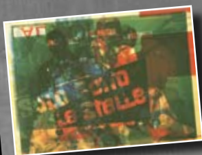
Mimmo Rotella Il Mappamondo