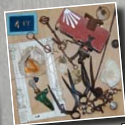
Daniel Spoerri Spirale Milano