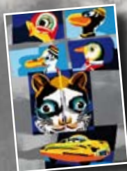
Ugo Nespolo Prospettive D'Arte