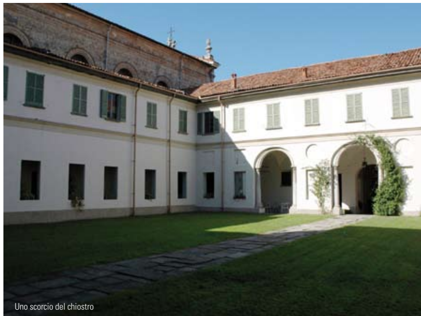
Uno scorcio del chiostro

Si ringrazia inoltre l'arch. Marina Rosa