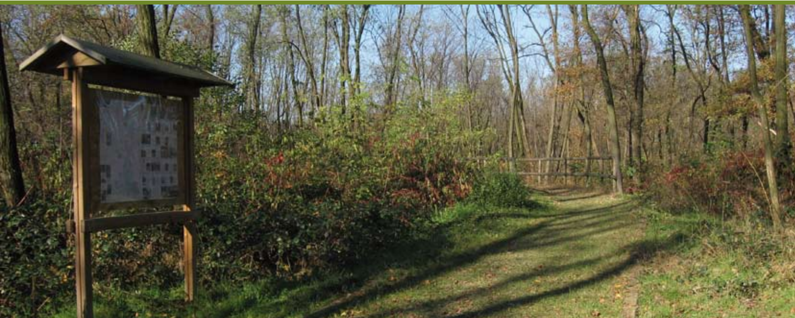
Un sentiero nel parco