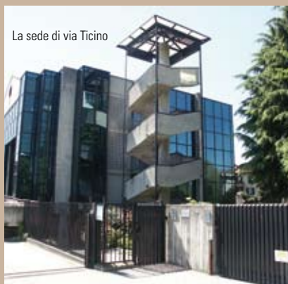
La sede di via Ticino

La data di fondazione del Collegio dei ragionieri del circondario di Monza viene fatta risalire al 20 settembre 1954. A partire da quel momento, e sino al 1975, come recitano chiaramente i verbali di assemblea dell'epoca, la sede del Collegio è stata quella di via Italia 46. Almeno dal 26 giugno 1975, fino al 1987, è stato poi concretizzato lo spostamento in via Sacconi 4. Infine, ultima sede del Collegio, dal 1° settembre 1987 al 31 dicembre 2007, via Borgazzi 83. La fondazione dell'Ordine dei dottori commercialisti, invece, è riconducibile al decreto costitutivo del 21 agosto 1954. Da una data imprecisata, ma certamente fino al 1992, gli uffici di via Dante sono stati la sede dell'Ordine.