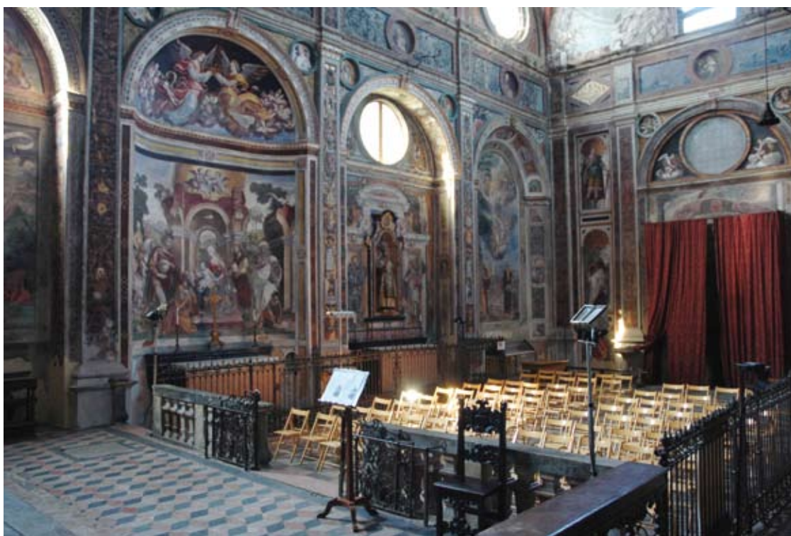
L'interno della chiesa di San Vittore

Q uello che si leva sopra il poggio di Meda è un lembo di Brianza ancorato a un passato millenario, in cui si fondono con mirabile esempio fede e storia, laboriosità e contemplazione. Il complesso architettonico che dà sulla piazza racchiude anche la grandiosa