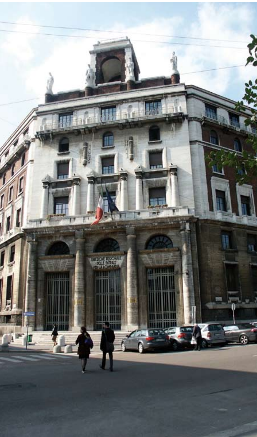
Nella foto il palazzo dell'Agenzia delle entrate

conda solo a quella di Milano con 1.992 soggetti. D. In alcuni casi l'utenza dei contribuenti, con l'accentramento nelle direzioni provinciali, lamenta un allontanamento della funzione di accertamento dal territorio: cosa state facendo per venire incontro a questa domanda? R. Vorrei ribadire un concetto: la logica della