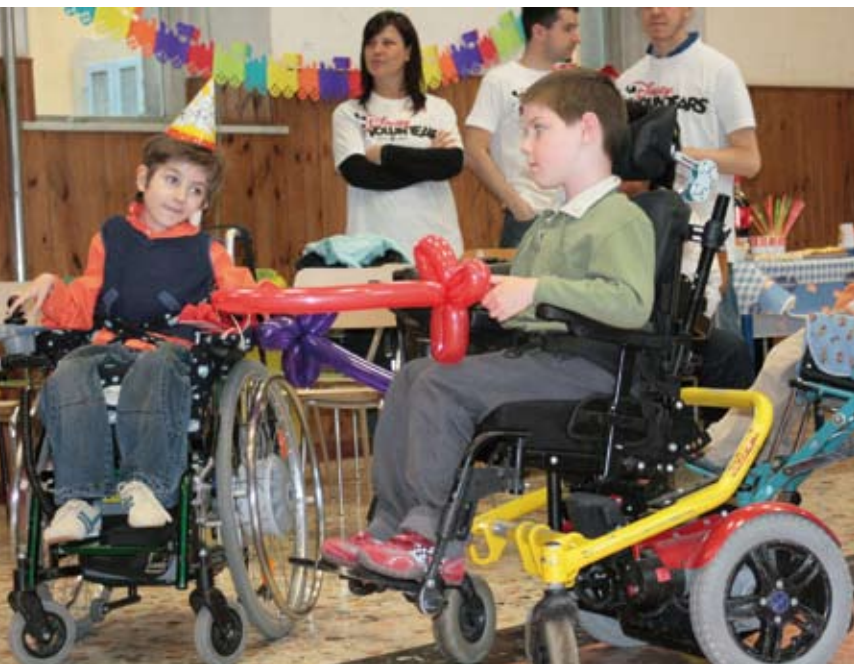
Un momento della Festa Disney organizzata dalla sezione di Monza