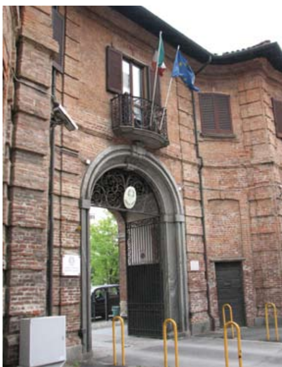
La sede del Comando del Gruppo di Monza