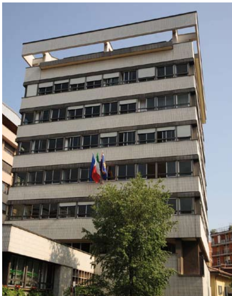
Nelle foto le sedi di piazza Diaz sopra e di via Tommaso Grossi a destra

Tutti i numeri e le risorse finanziarie di una realtà istituzionale ormai pienamente operativa